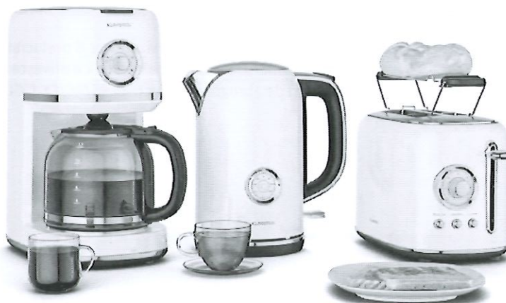
Set electrocasnice pentru mic dejun Klarstein Victoria

* Imaginile premiilor sunt cu titlu de prezentare